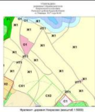
Фрагмент карты Некрасово (масштаб 1:5000)